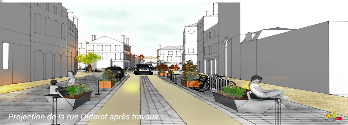
Projection de la rue Diderot après travaux

NB : si les bacs se remplissent rapidement, n'hésitez pas à contacter les services du SDED 52 03 25 35 09 29 - sded52@sded52.fr