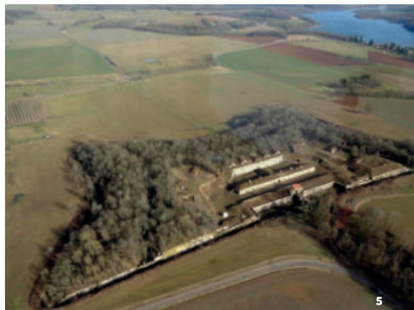
5. Vue aérienne du fort de Peigny