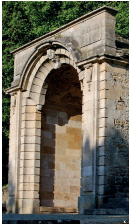
2. Fontaine de la Grenouille à Langres