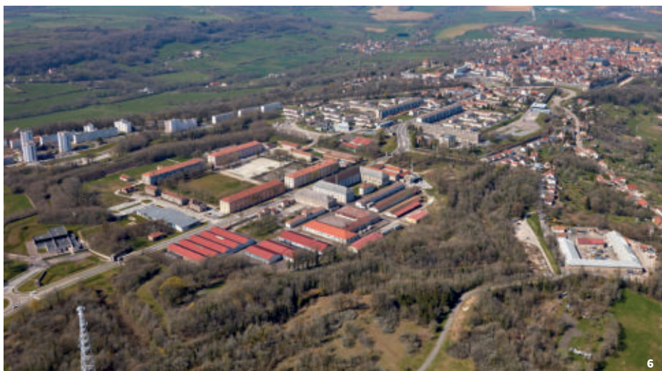
6. Vue aérienne de la citadelle de Langres