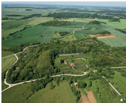
4. Vue aérienne du fort de la Bonnelle à Saints-Geosmes